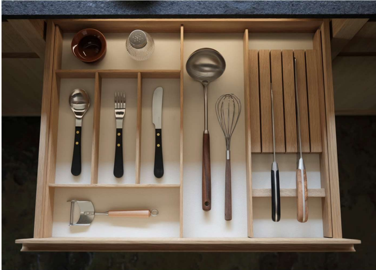
사진 예시) Divider 3 + 빈 공간 + Container 1

서랍내부에 사용편의에 맞게 디바이더(Divider)를 자유롭게 배치하여 효율적이고 안전하게 물품을 보관할 수 있습니다.